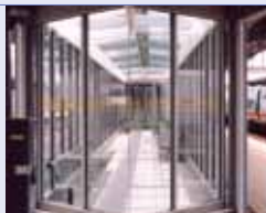
na de behandeling