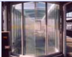
voor de behandeling